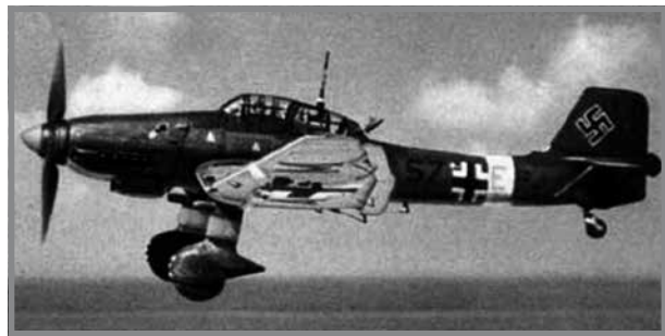
Junker Stuka

Dawn kienu ajruplani tal-gwerra Ġermanizi li ntużaw waqt it-Tieni Gwerra Dinjija. Ewlieni fost dan it-tip kienu l-iStukas. Dawn l-ajruplani ntużaw kemm-il darba għall-attakki fuq Malta.