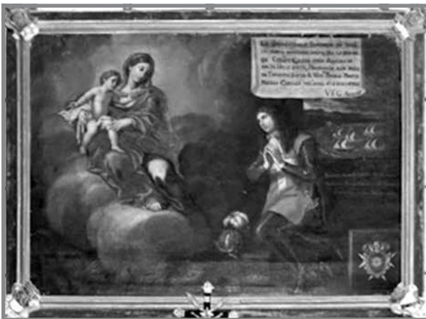
Wieħed mill-ex voto fis-Santwarju tal-Mellieħa ( http://www.kappellimaltin.com/Il-Kappelli/Sett05/MLH_Santwarju_Vitorja/Ritratti---Philip-Xuereb-----Ex-Voto-Mellieħa-088-b.jpg )

Is-Santwarju tal-Mellieħa huwa wieħed minn dawn u jippossjedi diversi kwadri ex voto. Hemm madwar 110 kwadri minn dawn u huma kklassifikati hekk: 63 - Marittimi, 24 - Mard, 6 - Accidenti fuq l-Art, 3 - Pesta, 5 - Isqfijiet u 9 - Ġrajjet oħra u Rigali 14 .