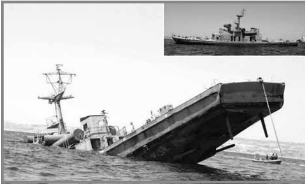
Il-P29 qed jiġi mgħarraġ fiċ-Ċirkewwa (Times of Malta 15th August 2007)

tal-1992. Fl-istess inħawi taħt il-baħar insibu wkoll statwa tal-Madonna tal-Għaddasa li kienet tpoġġiet hemm fl-1987 12 .