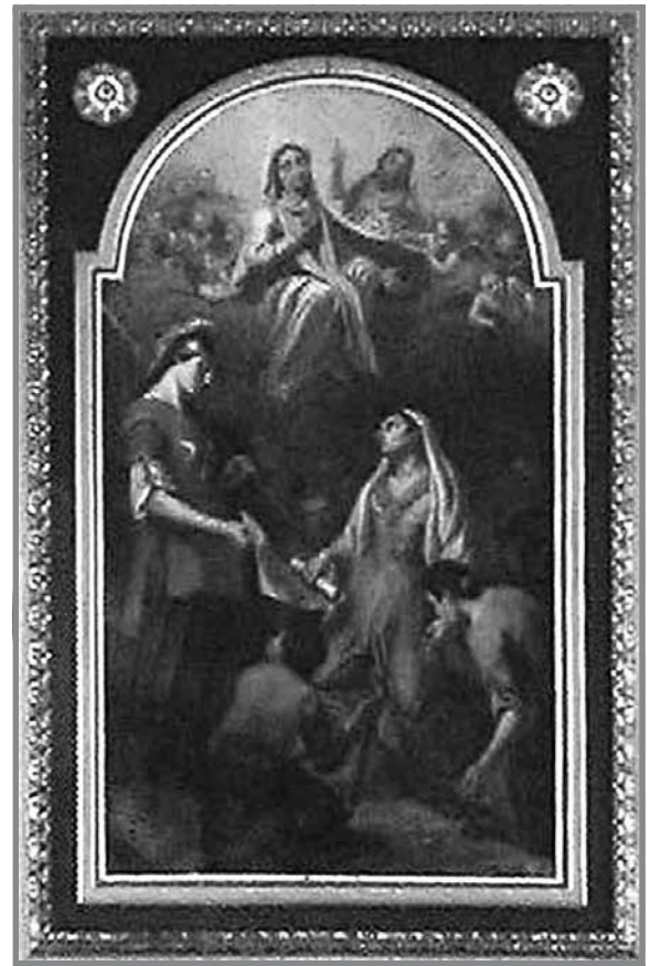
Il-Madonna tal-Fidwa f'Selmun ( http://www.malta-canada.com/churches-chapels/Mellieħa.htm )